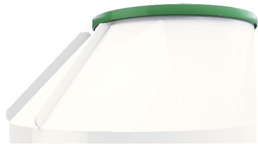
Reningsverket kan levereras med konisk hals.